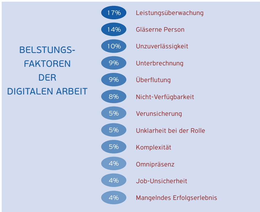
Abbildung 2 – Belastungsfaktoren und der prozentuale Anteil von Beschäftigten, die von einer sehr starken Ausprägung berichten (Gimpel et al., 2019)

Im Folgenden werden die zwölf Belastungsfaktoren der digitalen Arbeit erklärt und möglichen Lösungsansätzen diskutiert.